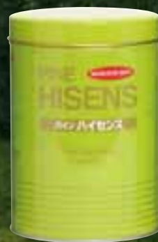
薬用入浴剤・医薬部外品 パイン・ハイセンス

ありがとうございます。 これからも皆さまと共に、 健康と美と、生きがい求めて 歩いていきます。