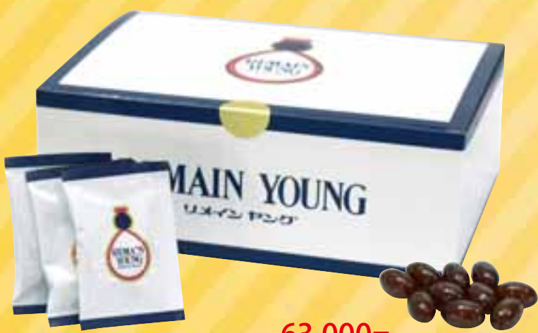
販売店価格 63,000円 価格: 90,000円 4箱 (460mg×10粒×25袋)