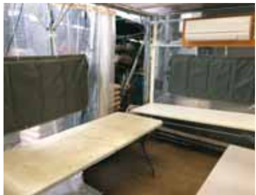
DENBAのシートが貼られた選果場の内部。ここに軽トラごと入れて作業をする。果物をいたずらに動かしたり触れたりしないことで、作業効率を上げると同時に傷みを防ぐ。