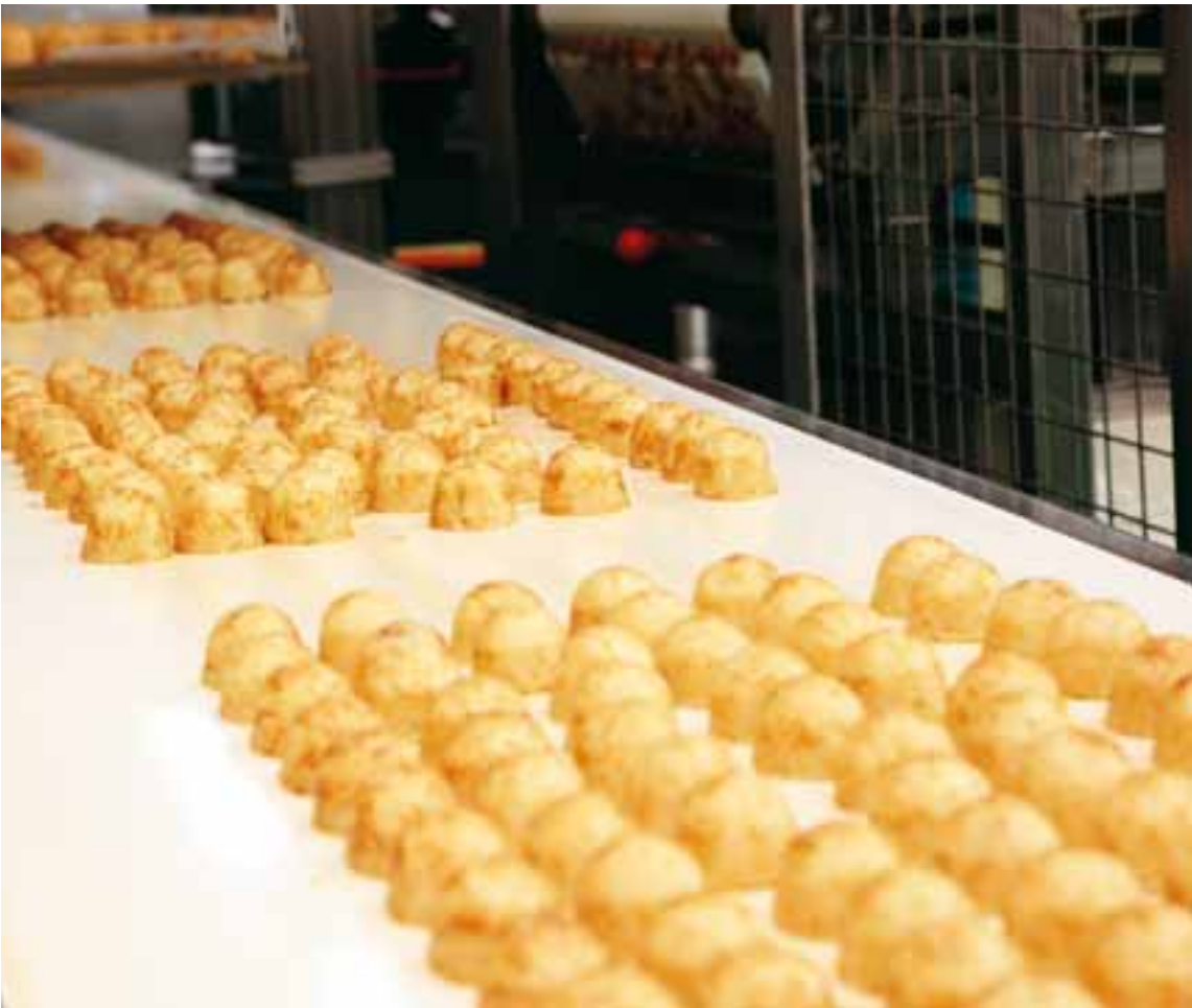
小国工場で生産されるたこ焼。鮮度の高い食材を使って生産しすぐに冷凍。家庭のレンジで温めるだけで、つくりたてのおいしさがいつでも味わえる。