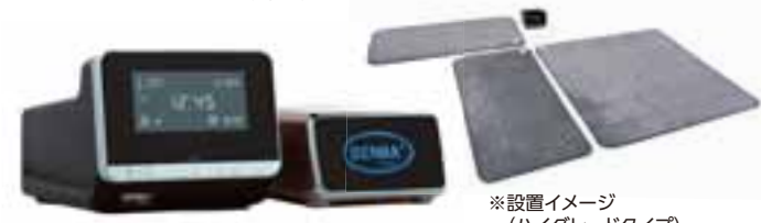
※設置イメージ (ハイグレードタイプ)