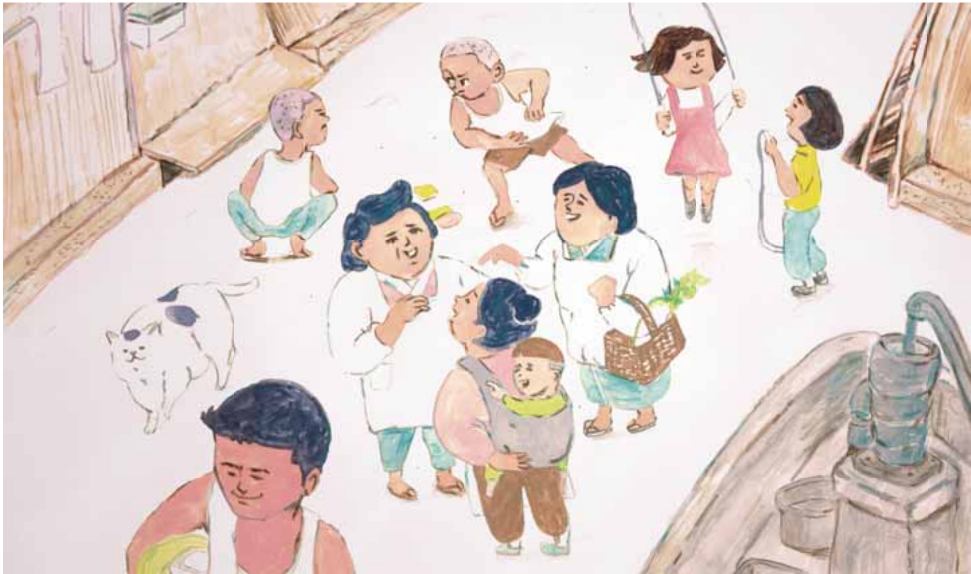
イラスト・堀口ティモコ