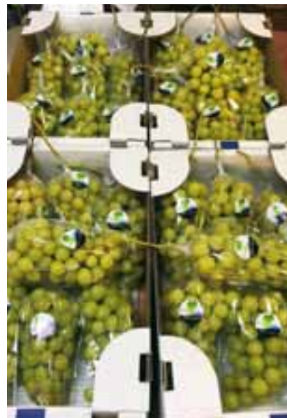
DENBAで冷蔵保管することで、9~10月に収穫したシャインマスカットを、お正月を過ぎても食べることができるという。