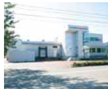
冷凍食品の生産拠点の小国工場。

新 潟県長岡市小国町。豊かな自然と町を流れる洪海川の水が、この地の産業を形成してきた。その小国に冷凍食品の生産工場を構えるのが、株式会社ピーコックだ。たこ焼を主力商品に、今川焼、たい焼などを生産。使う食材は、地元小国町のネギをはじめ鮮度と品質にこだわっているという。そんな小国工場が、このたび野菜とタコの冷蔵庫にDENBA+2・0を2台導入した。放電防水