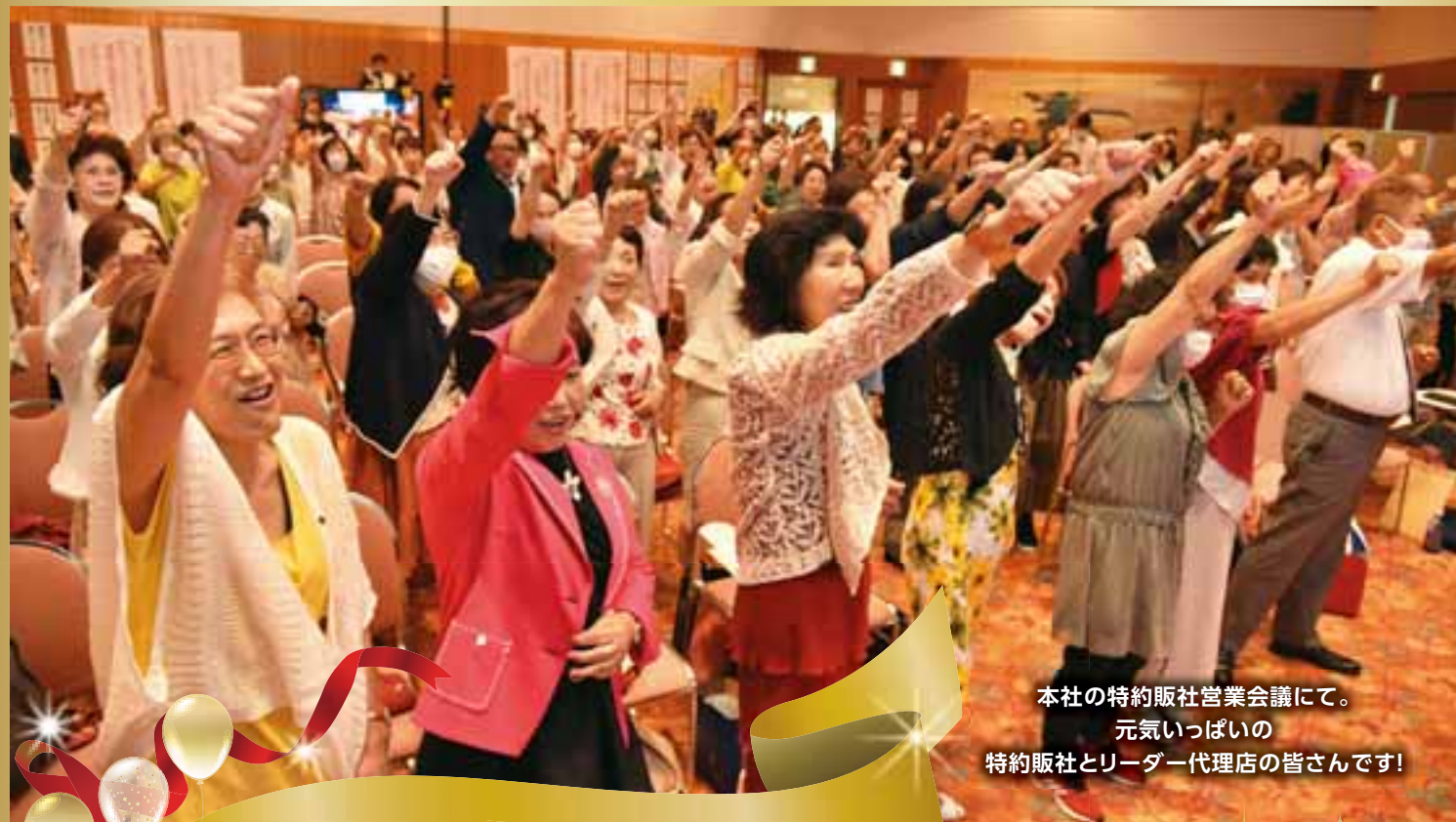
本社の特約販社営業会議にて。 元気いっぱい 特約販社とリーダー代理店の皆さんです!