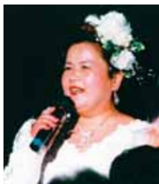
50歳のとき地元和歌山で開いた歌謡ショーでは、700人ものお客さんが集まりました!

74歳にして和歌山県の小さな町から、車を自分で運転して全国どこへでも出かけます。岐阜羽島の本社のセミナーにも代理店を乗せて、片道約4時間を一人で運転して行くのだそう。「疲れやだるさは全くありません!」