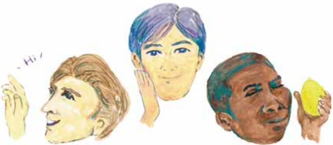
視覚で判断する欧米人、触覚で判断する日本人、匂いで判断するアンダマン諸島のオンギー族。

肌のセンサーは想像を超える敏感さを持ちます。指先は数ミクロンの凸凹を認識し、さらに脳で認識する前に、皮膚の感覚で体が適切に反応する仕組みも備わっていることが、研究によってわかってきています。