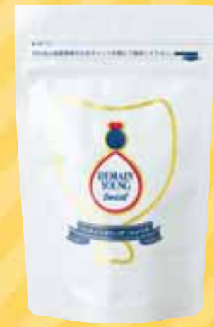
販売店価格 6,300円 価格: 9,000円 1袋 (1.5g×18粒)