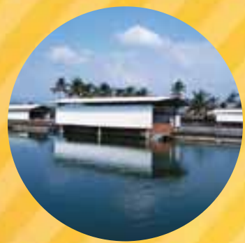
抗生物質不使用の環境で育ったスッポンの卵を使っています！