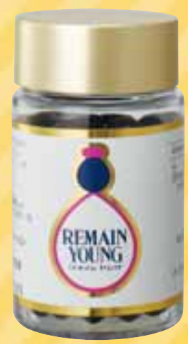
販売店価格 6,300円 価格: 9,000円 1本 (460mg×90粒)

リメインヤングに使われている素材の一つ、スッポンの卵。スッポンには、男性のエネルギーチャージに良いというイメージがあるため、ちょっと抵抗が…と考える女性の方もいらっしゃるようです。しかし、その心配は要りません！老若男女、誰もが安心してお召し上がりいただける理由をお教えします。