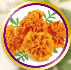
ルテイン (マリーゴールド抽出物)