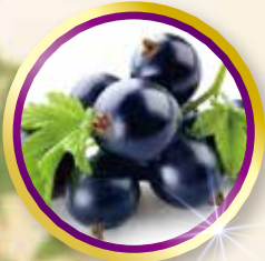
黒すぐり (カシスエキス)