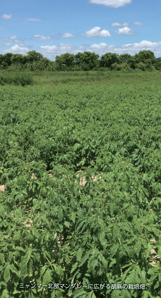
ミャンマー北部マンダレーに広がる胡麻の栽培畑。